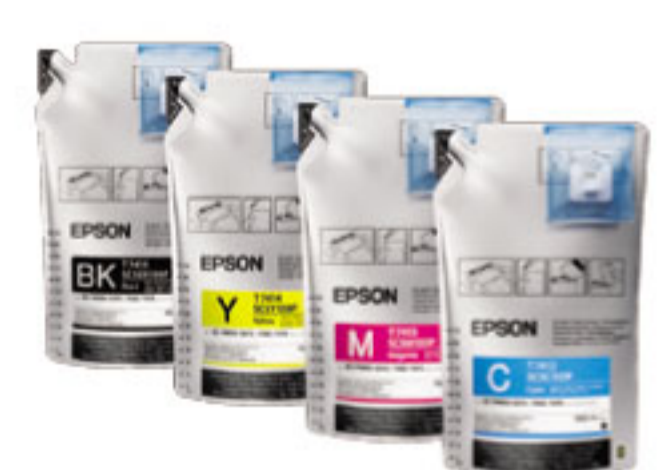
SC-F7270 ตลับหมึกชนิดเติมความจุสูง 1 ลิตร***