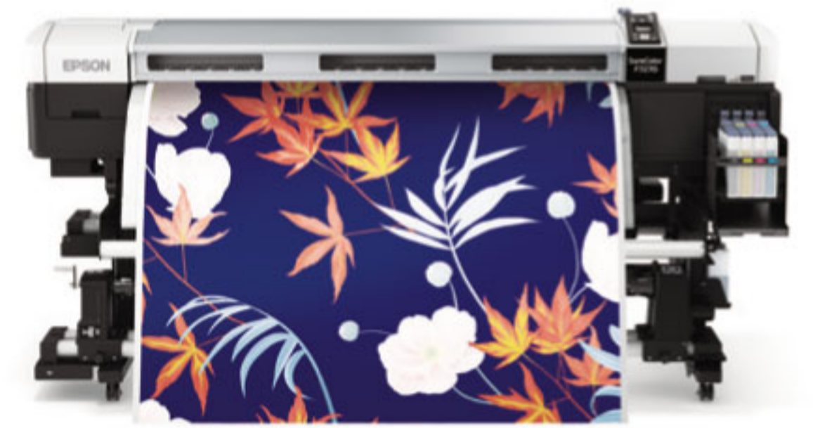
SC-F7270 Dye-Sub ม้วนต่อม้วนหน้ากว้าง 64 นิ้ว