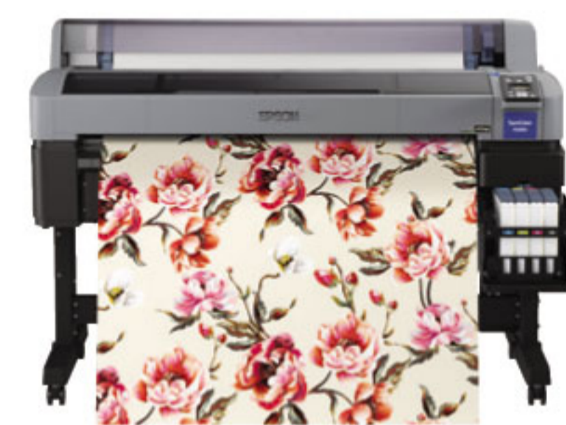
SC-F6330 Dye-Sub หน้ากว้าง 44 นิ้ว