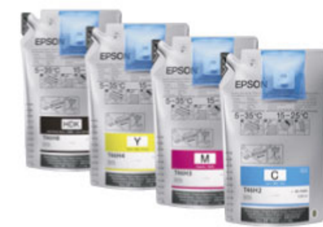
SC-F6330 ตลับหมึกชนิดเติมความจุสูง 1.1 ลิตร***